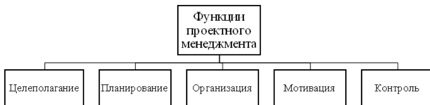
Рис. 2. Основные функции проектного менеджмента*

Реализация проектов на предприятиях пищевой промышленности и, соответственно, осуществление проектного управления возможно посредством реализации основных функций проектного менеджмента (рис. 2).